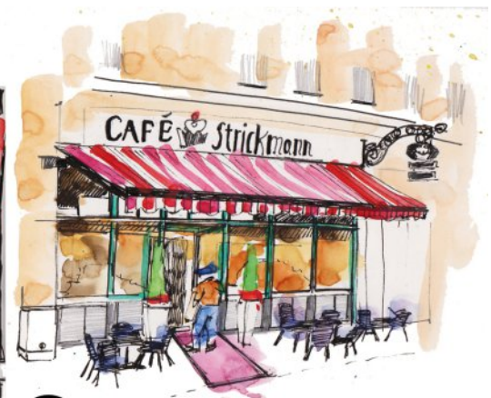
③ Café Strickmann