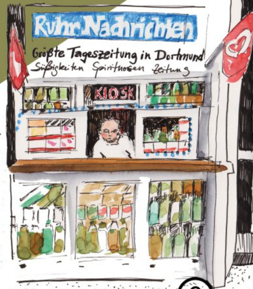
Kiosk Hansastraße ②