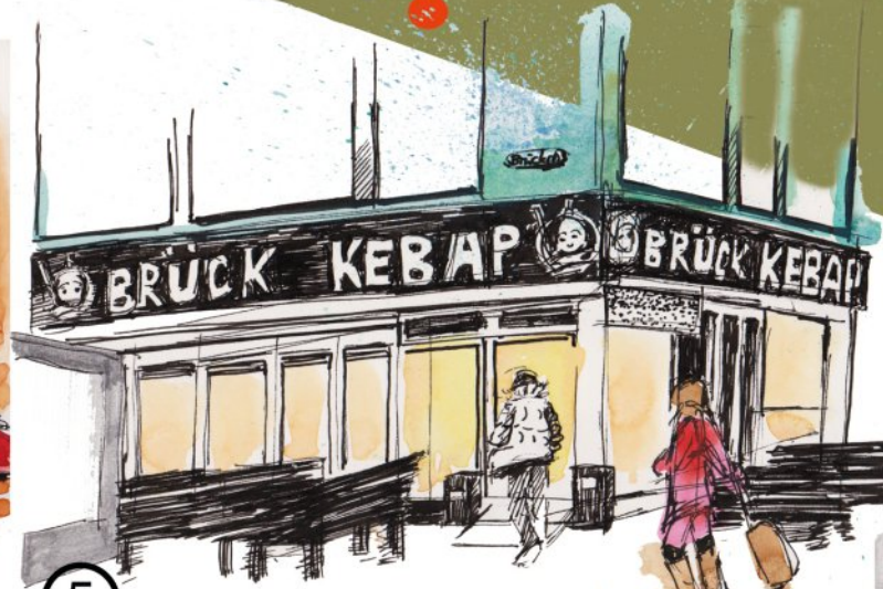
⑤ Brück Kebap