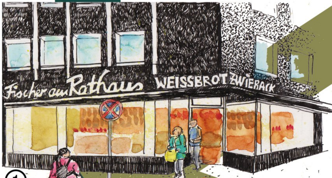
① Fischer am Rathaus