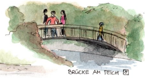
BRÜCKE AM TEICH 5